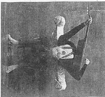
Le Spettatori Movement Theatre. Un show chaud. ZENIATAKACHE

Particularité: les protagonistes en sont... les parties de son propre corps! Les pieds, les jambes, les mains ou les genoux de la dame se métamorphosent ainsi en créatures fantastiques. Irratable, ce dimanche. PH.M.